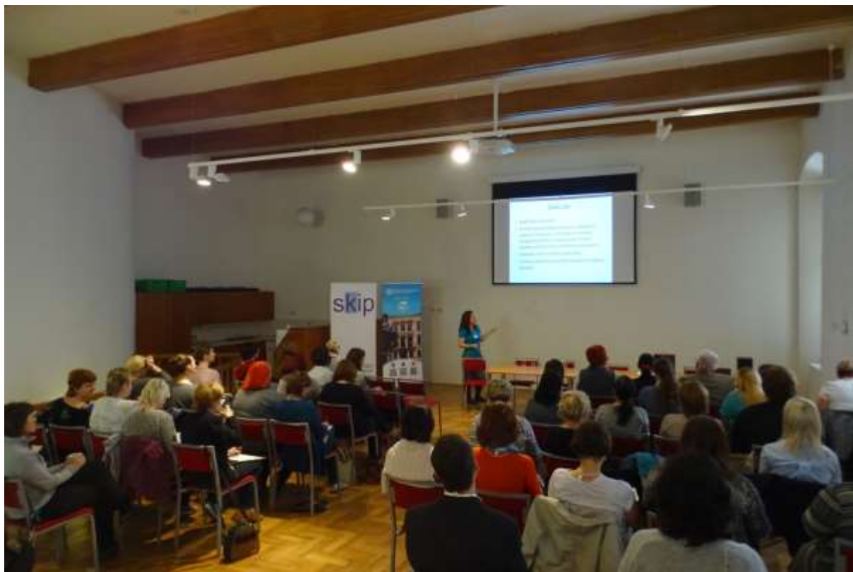
IV. workshop pro metodiky knihoven – Olomouc 2017

Zárukou přímé spolupráce a pomoci jsou knihovny pověřené výkonem regionálních funkcí. Jim a především jejich pracovníkům patří poděkování za jejich práci.